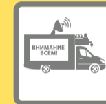
ПОДВИЖНЫЕ ЗВУКОУСИЛИТЕЛЬНЫЕ УСТАНОВКИ